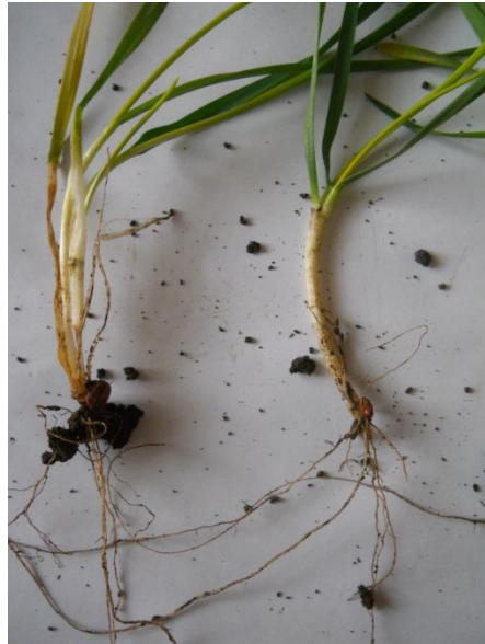
Sl.1 bez obrade Sl.2 tanjiranje Sl.3 tanjiranje