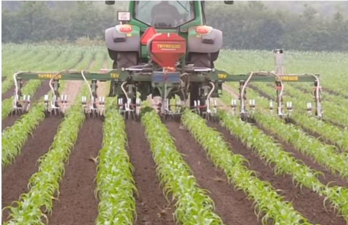
Sl.1. Kultiviranje kukuruza

Ukoliko se izvodi međuredna kultivacija treba naglasiti da je neophodno ovu operaciju započeti što ranije, kada kukuruz ima 3-4 lista (prvi put) na dubini od 6-8 cm, odnosno kada imaju 6-8 listova (drugi put) na dubinu od 4-6cm. Ponekad se izvodi i treća međuredna kultivacija kad kukuruz ima više od 8 listova na dubinu od 3-4cm. U slučajevima kada je neophodno suzbijanje rizomnog divljeg sirka sa nekim od herbicida odmah nakon nicanja kukuruza, međuredna kultivacija mora se odložiti za 10 do 15 dana nakon aplikacije herbicida.