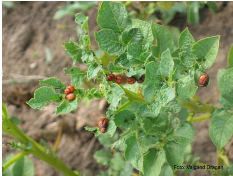
Larve krompirove zlatice

acetamiprid), ili Actara 0,6-0,8-zlatica (a.m. tiametoksam), ili Chess 50 WG 0,4-0,6 kg/ha (a.m. pimetrozin), itd.