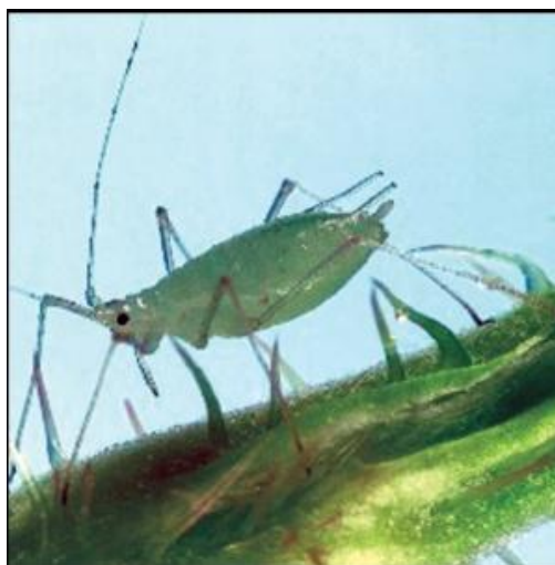
Jedinka lisne vaši

Po pojavi prvih kolonija, izvršiti tretman suzbijanja lisnih vašiju u POVRTARSKIM USEVIMA jednim od sledećih preparata: Chess 50 WG 0,4-0,6 kg/ha (a.m. pimetrozin), Mospilan 0,25 kg/ha ha (a.m. acetamiprid), Actara 0,12-0,15-l/ha (a.m. tiametoksam), Confidor 200-SL 0,6 l/ha (a.m. imidakloprid).