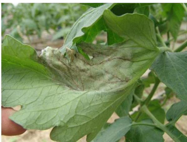
Simptomi plamenjače na paradajzu

mankoceb), Quadris 0.75 l/ha (azoksistrobin), Equation pro WG 0,4 kg/ha (a.m. famoksadon + cimoksanil), Folio Gold 2,5-3,0 kg/ha (a.m. METALAXIL-M + hlortalonil ) i.t.d.